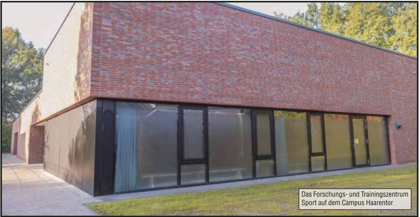
Das Forschungs- und Trainingszentrum Sport auf dem Campus Haarentor

8 Uhr morgens bis 22 Uhr abends genutzt werden. Bei Kursen mit einer Dauer von 1 – 1,5 Stunden bekommt man da einiges untergebracht.“, erklärt Martin Hillebrecht, Leiter der Zentralen Einrichtung Hochschulsport. Damit werden auch verschiedene Typen von Sportler*innen bedient, jene, die gern früh aktiv sind und auch die, die lieber länger aufbleiben; gestaltet wurde der Raum dabei in hellen Weiß- und Grautönen mit großen Fensterfronten. Die Hintergründe dafür gehen laut Hillebrecht bereits in die 80er Jahre zurück: „Die Räume sind unter dem Gesichtspunkt gebaut worden, dass man Sportstätten schafft, in denen sich Menschen wohlfühlen können. Die Kollegen in den 80ern haben das humanökologisch genannt.“ Wichtig sei dabei ein Tageslichteinfall sowie ein Blick nach draußen in die Natur, damit man sich nicht fühle, wie in einem Schuhkarton.