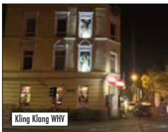
Kling Klang WHV

21, Tel.: 04408/7575 • Rastede: Palais Rastede, Feldbreite 23, Tel.: 04402/81552 • Seefeld: Kulturz. Seefelder Mühle, Hauptstr. 1 Seefeld, Tel.: 04734-1236 • Wardenburg: Wassermühle, Wassermühlenweg 14, Tel.: 04407/919800