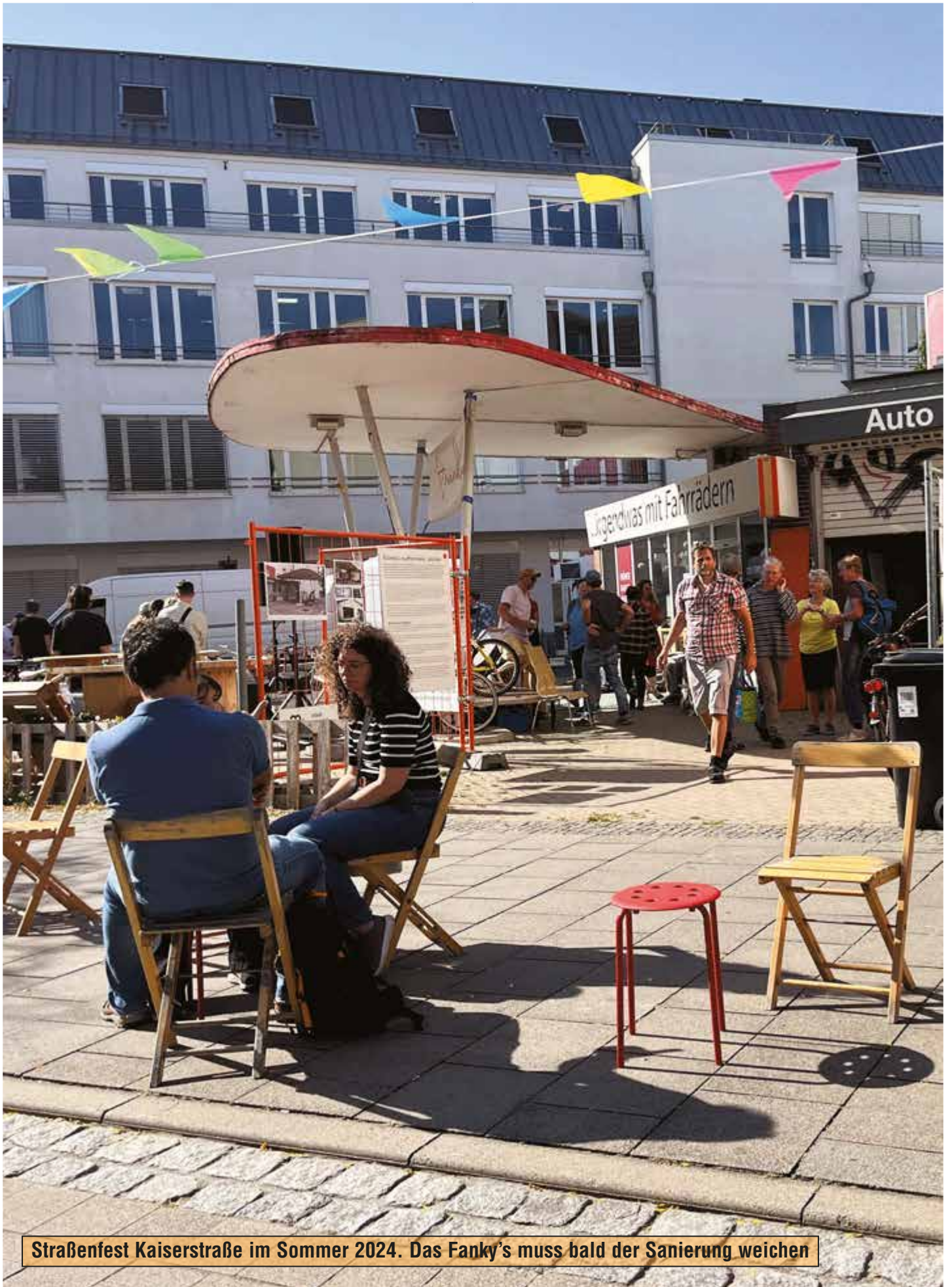
Straßenfest Kaiserstraße im Sommer 2024. Das Fanky's muss bald der Sanierung weichen