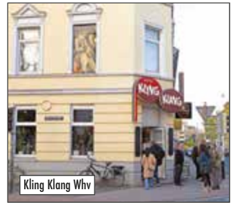
Kling Klang Whv